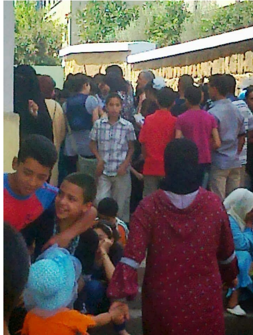
اكتظاظ في فترة التسجيل