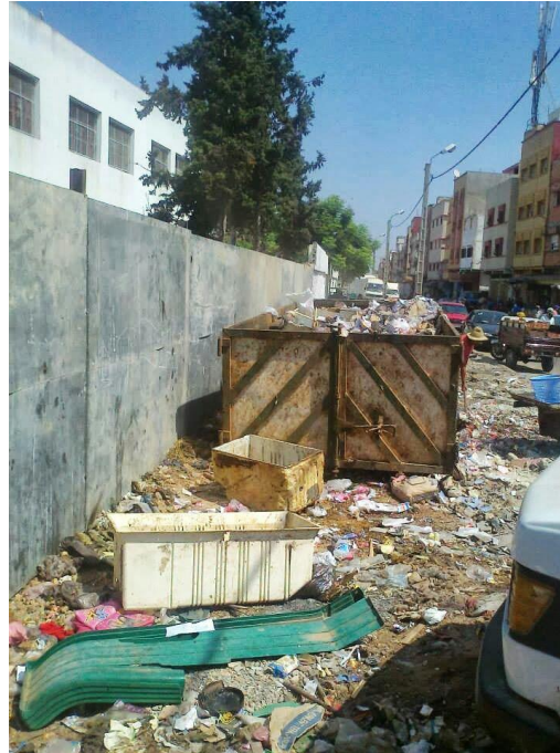
مشكل النظافة بمحيط المؤسسة